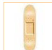
tabla de Skateboard Alai Marcas de moda con descuento.