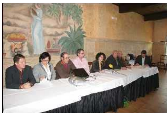
La asociación promueve el turismo rural como una de las alternativas económicas para el camp d'Elx

Marco anunció que se va a preparar la solicitud y, junto a una serie de argumentos técnicos, se defenderá que frente a los nueve kilómetros de costa, el término municipal dispone de 300 kilómetros cuadrados de campo, y que Elche no vive del turismo de sol y playa.